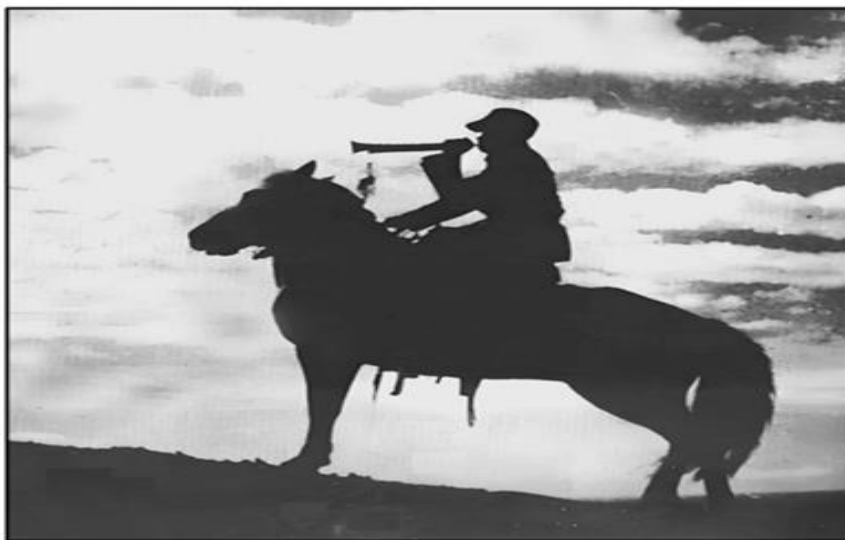
图1电影剧照——骑兵军号手

1938 年 10 月，根据延安文艺的发展需求，延安电影团的第一部影片《延安与八路军》在陕西桥山黄帝陵前开拍，1940 年 3 月完成拍摄。